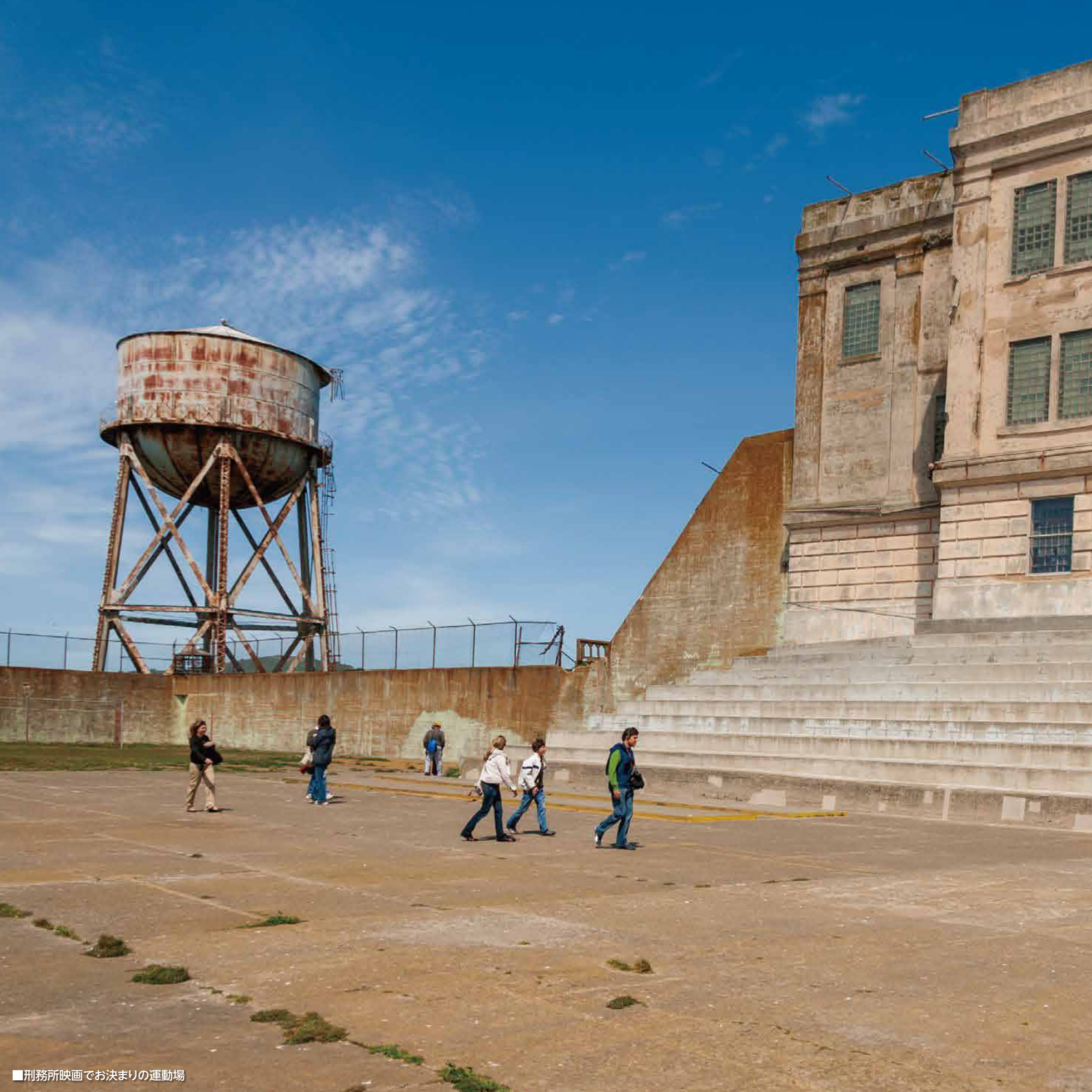
■刑務所映画でお決まりの運動場