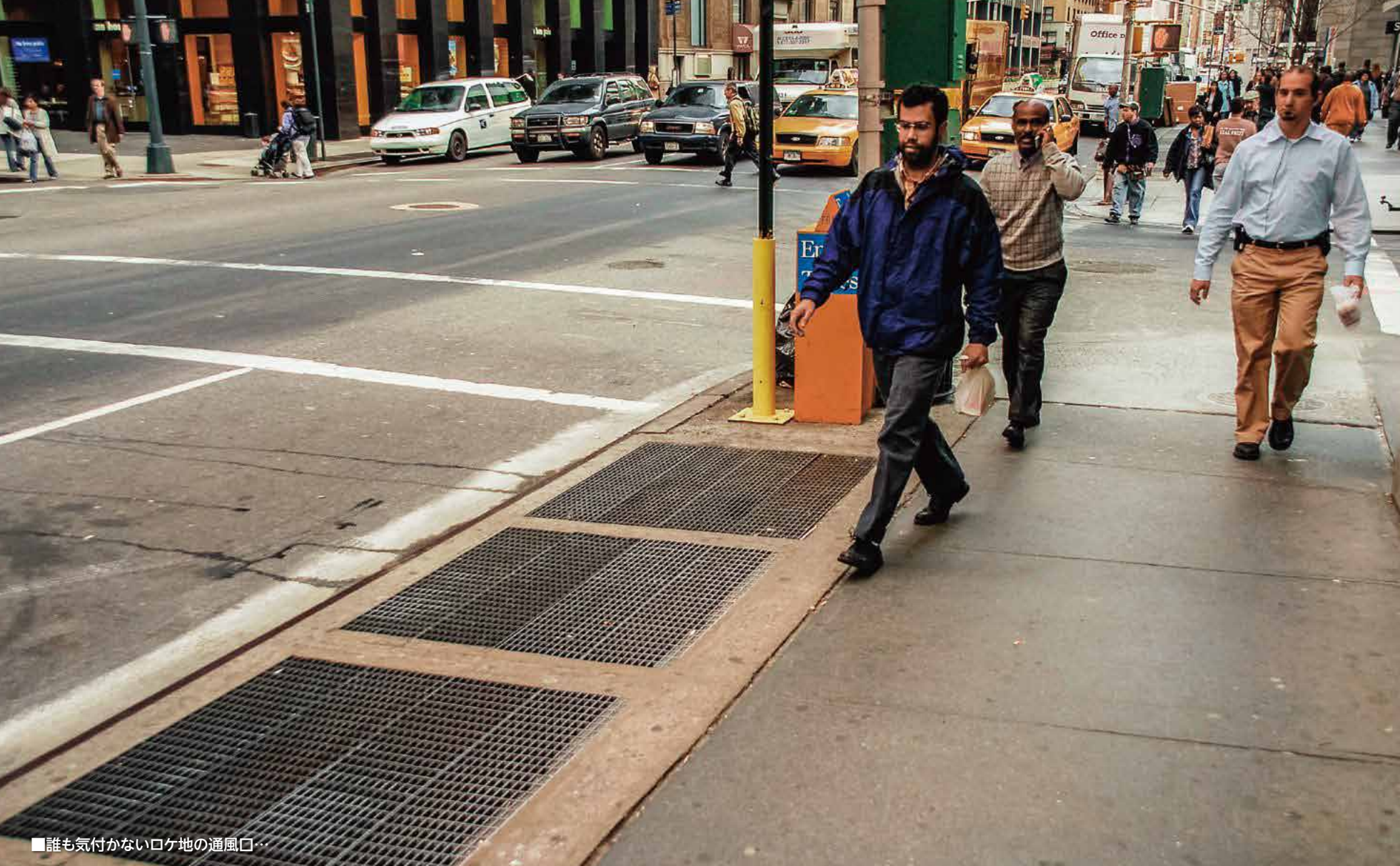
■誰も気付かないロケ地の通風口…