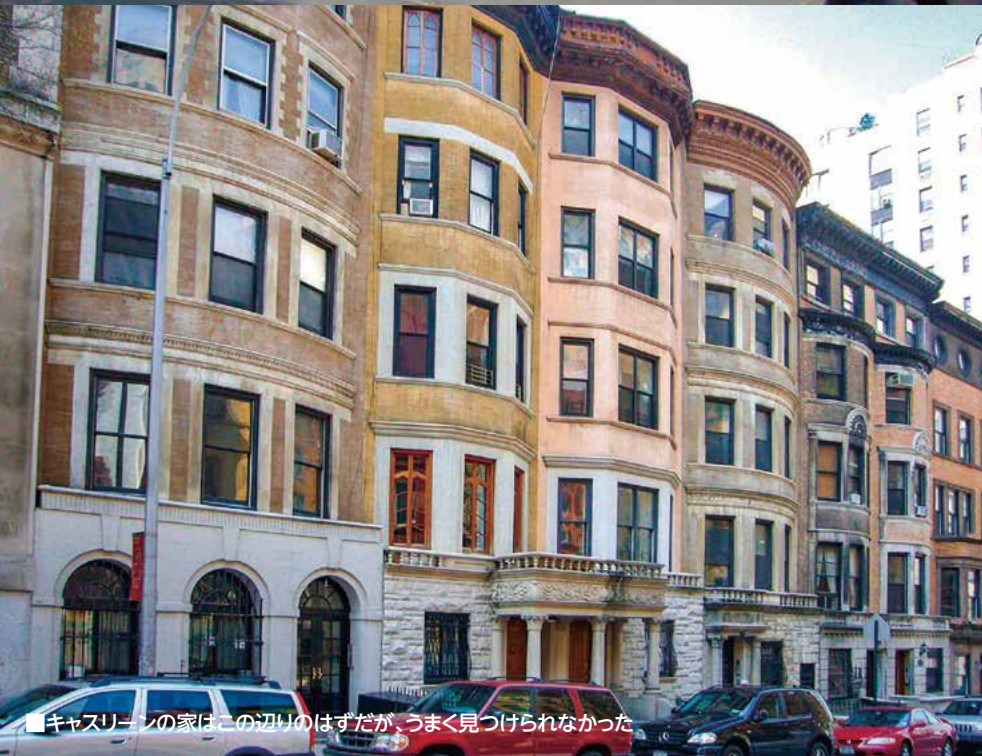
■キャスリーンの家はこの辺りのはずだが、うまく見つけれなかった