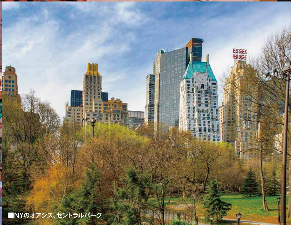
■ NYのオアシス、セントラルパーク