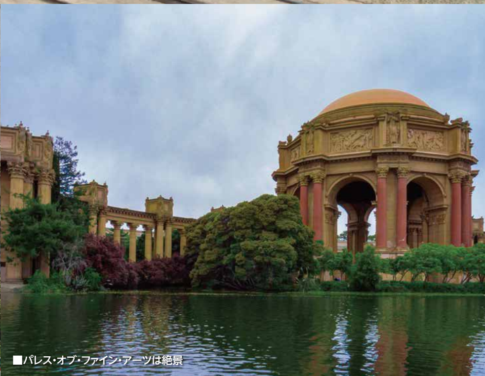
■パレス・オブ・ファイン・アーツは絶景