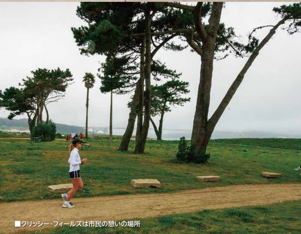
■グリッシー・フィールズは市民の憩いの場所