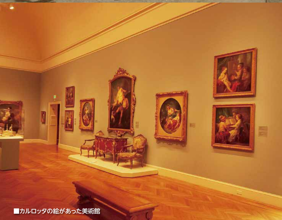
■カルロッタの絵があった美術館