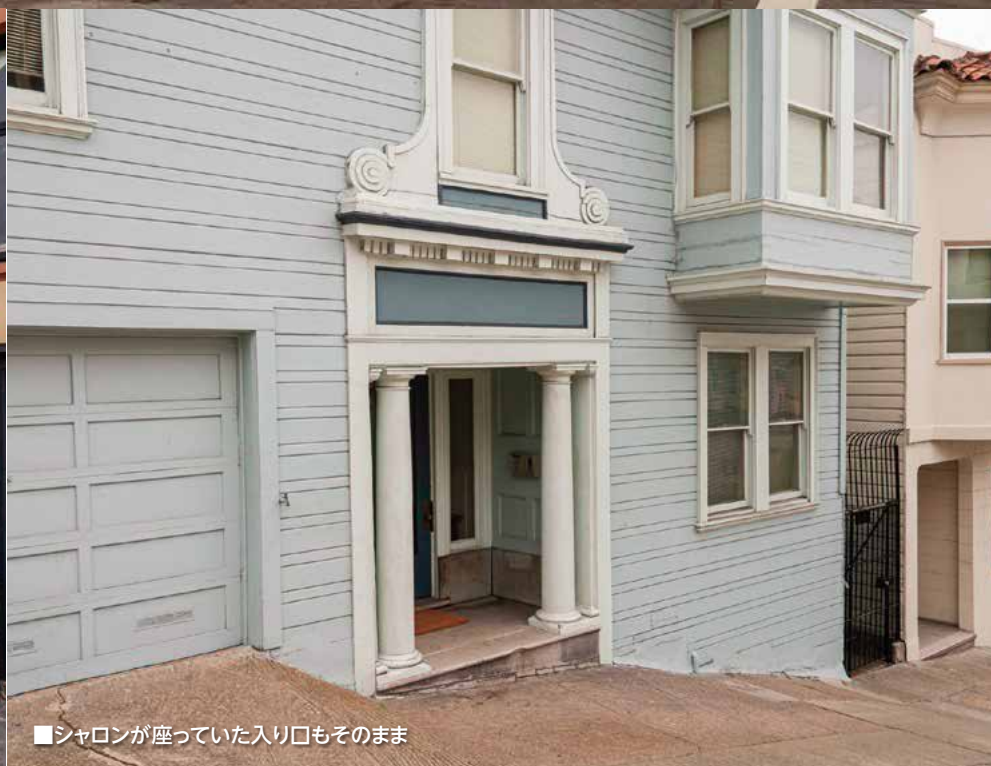
■シャロンが座っていた入り口もそのまま