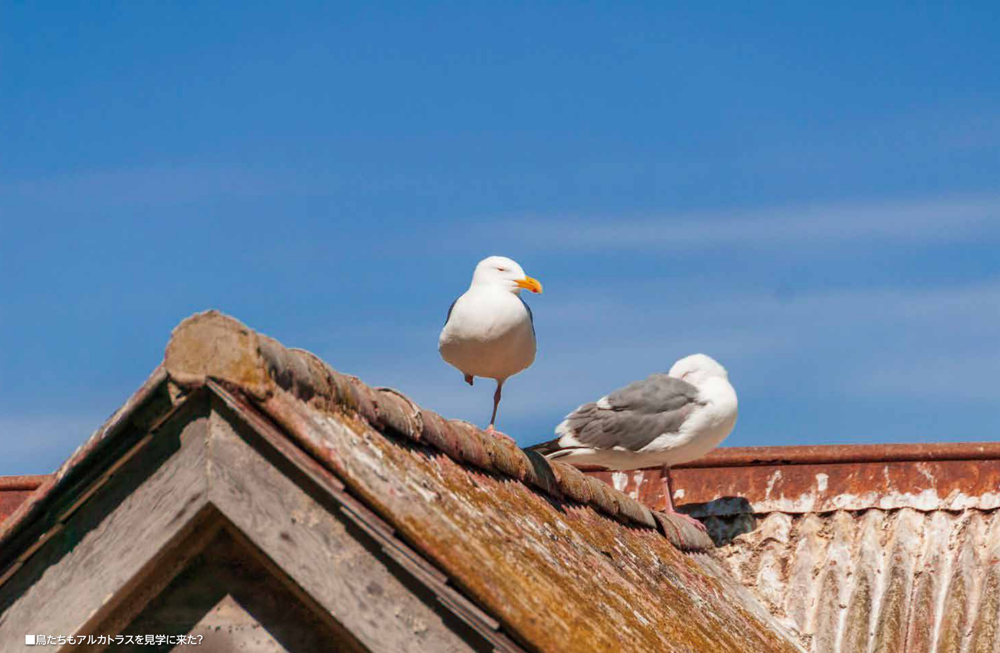
■鳥たちもアルカトラスを見学に来た？