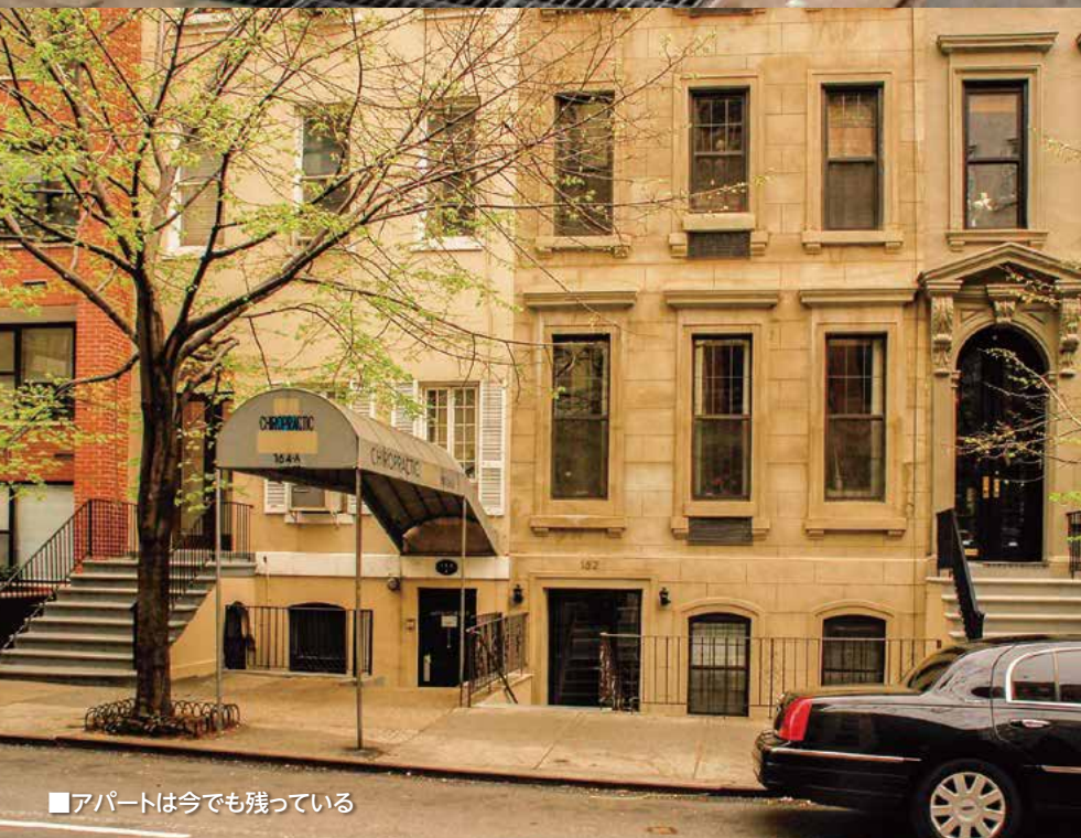
■アパートは今でも残っている