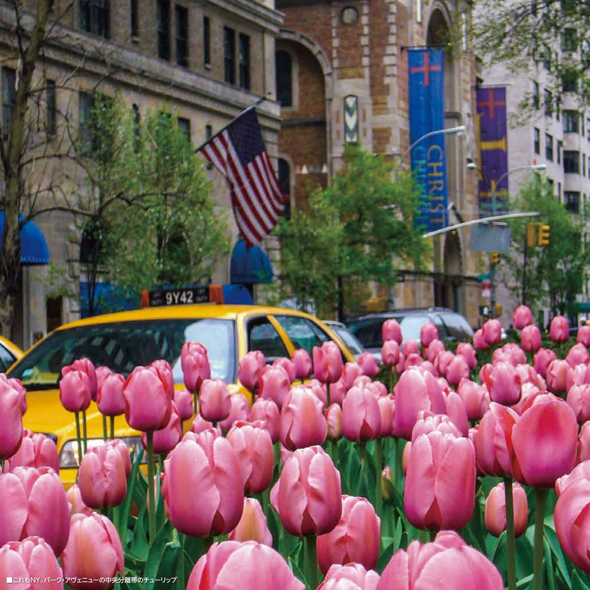
■これもNY。パーク・アヴェニューの中央分離帯のチューリップ