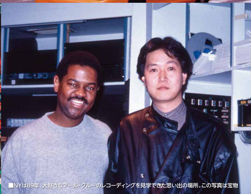
■NYは89年、大好きなアール・クルーのレコーディングを見学できた思い出の場所。この写真は宝物