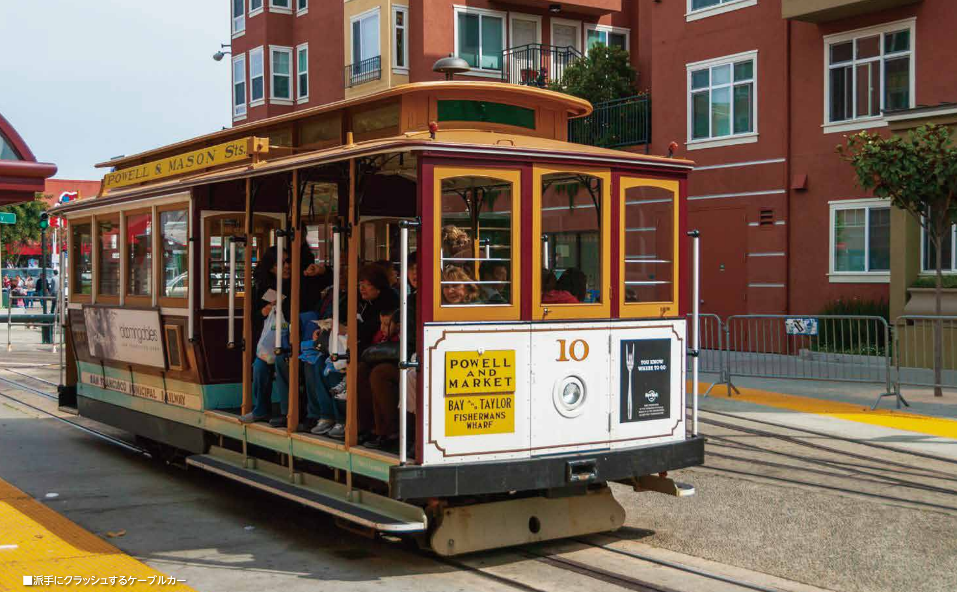
■派手にクラッシュするケーブルカー