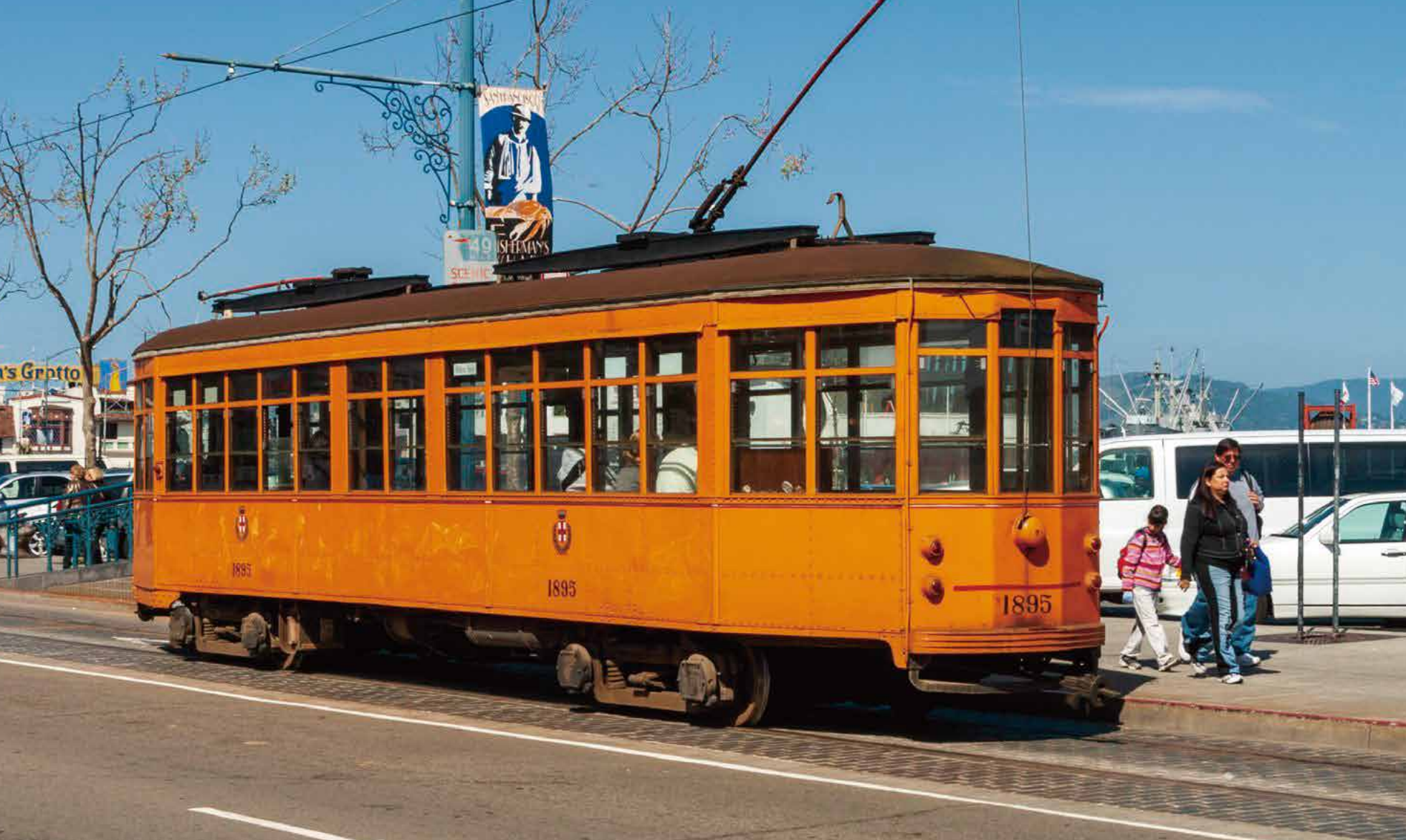
■いろんなトラムが走っていて見てて飽きない