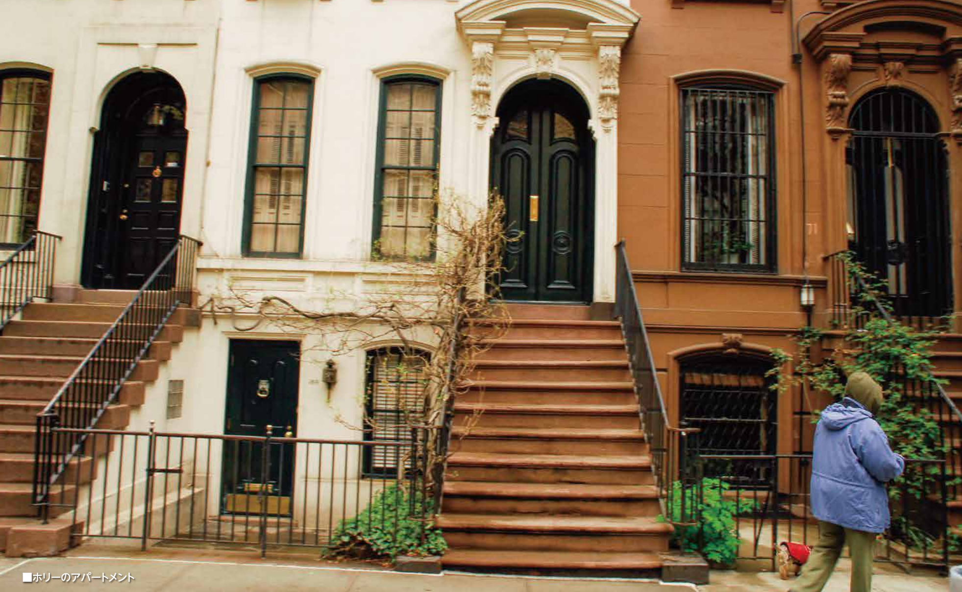
■ホリーのアパートメント