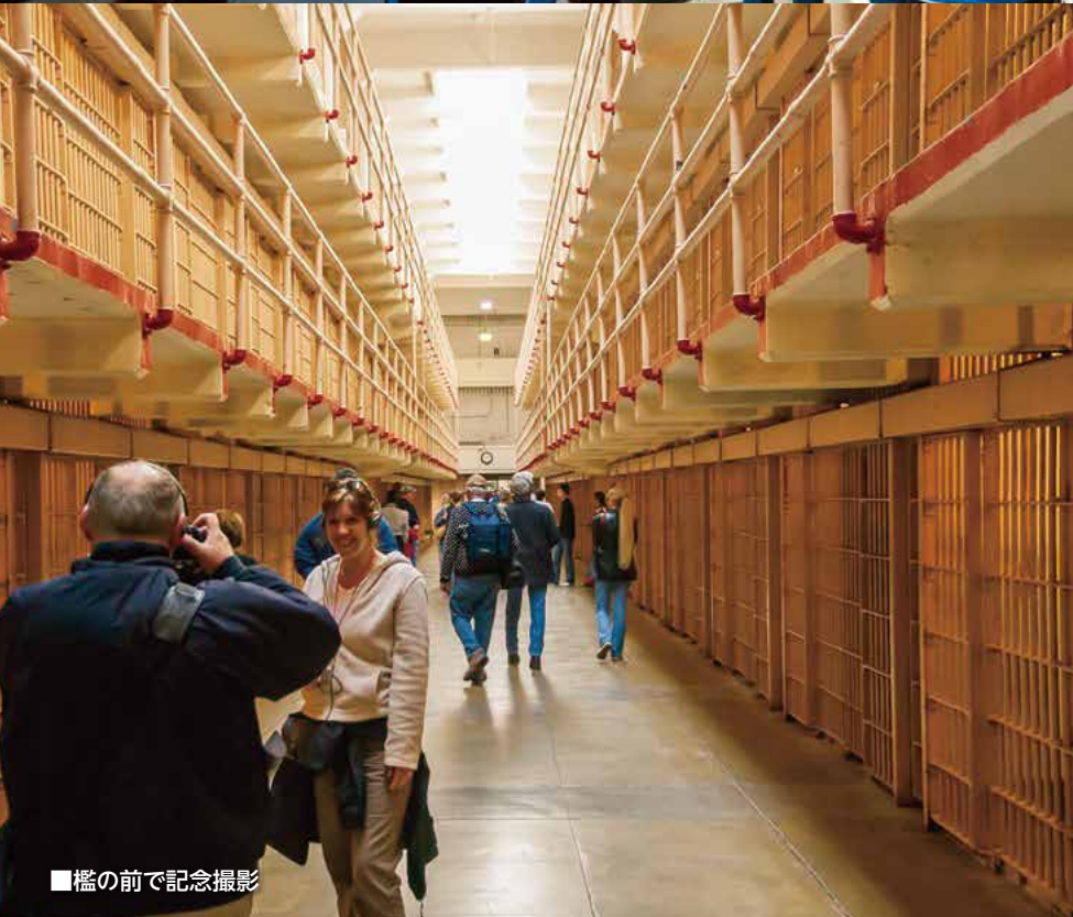
■檻の前で記念撮影