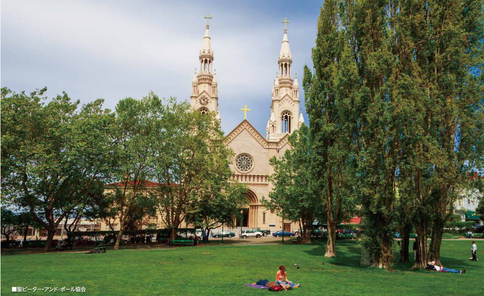
■聖ピーター・アンド・ポール協会