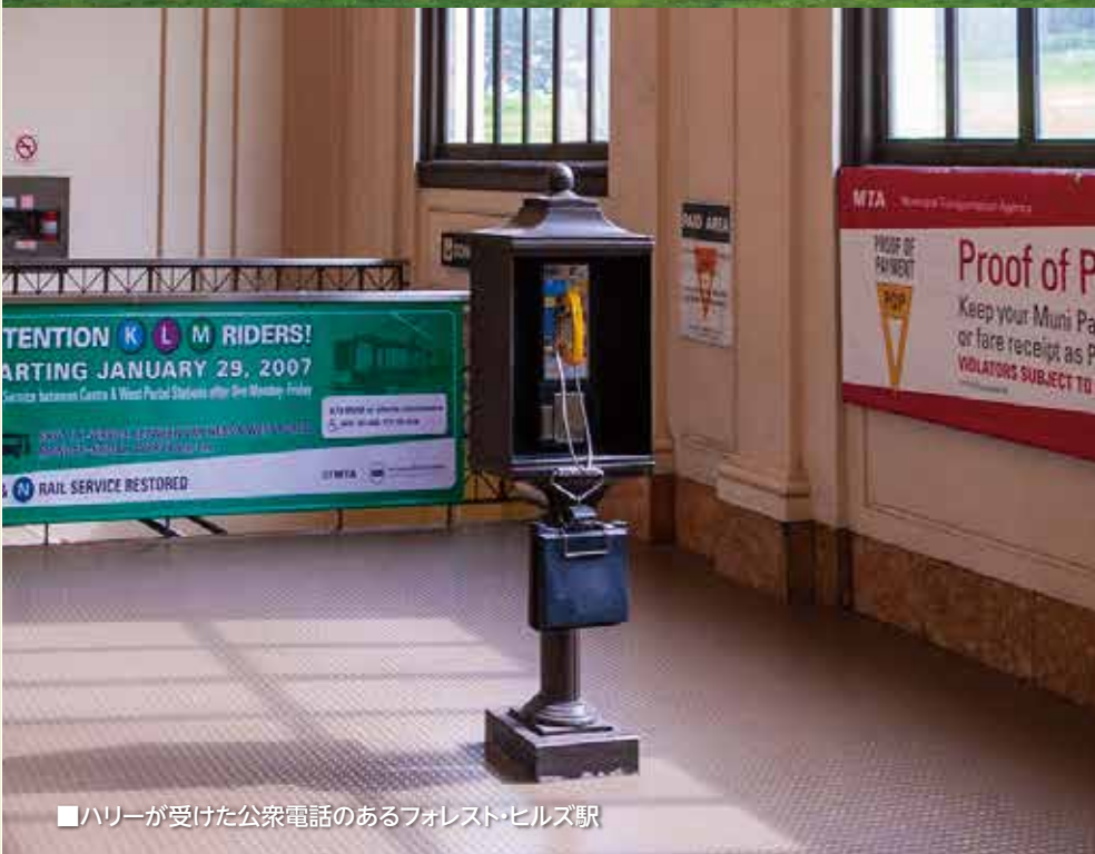
■ハリリーが受けた公衆電話のあるフォレスト・ヒルズ駅