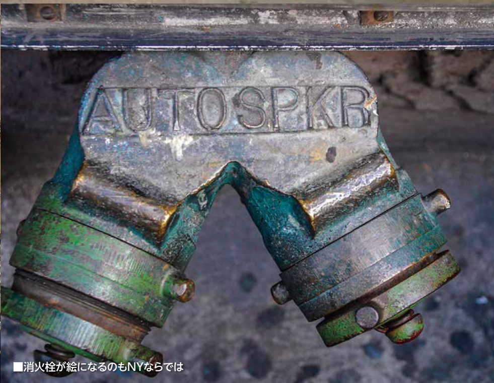
■消火栓が絵になるのもNYならではの