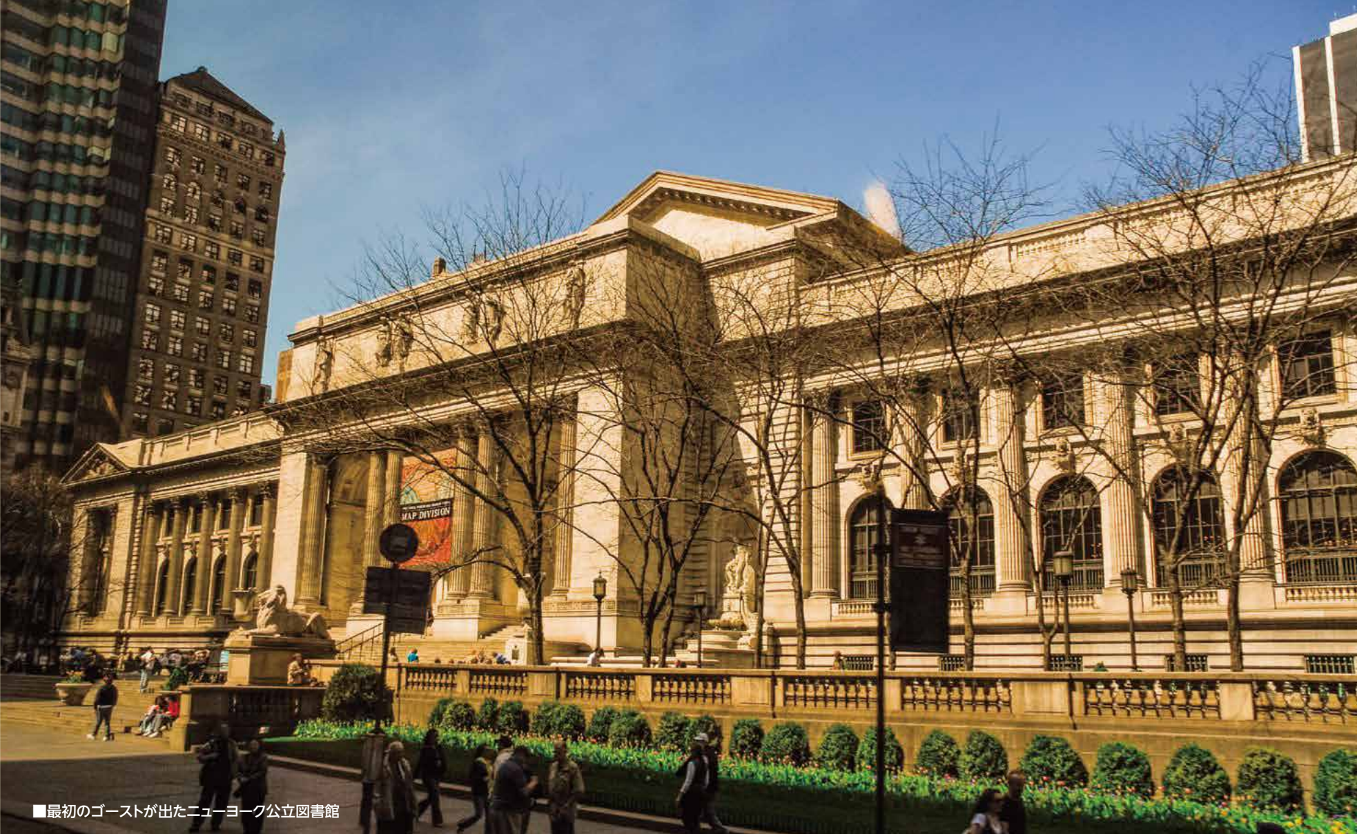
■最初のゴーストが出たニューヨーク公立図書館