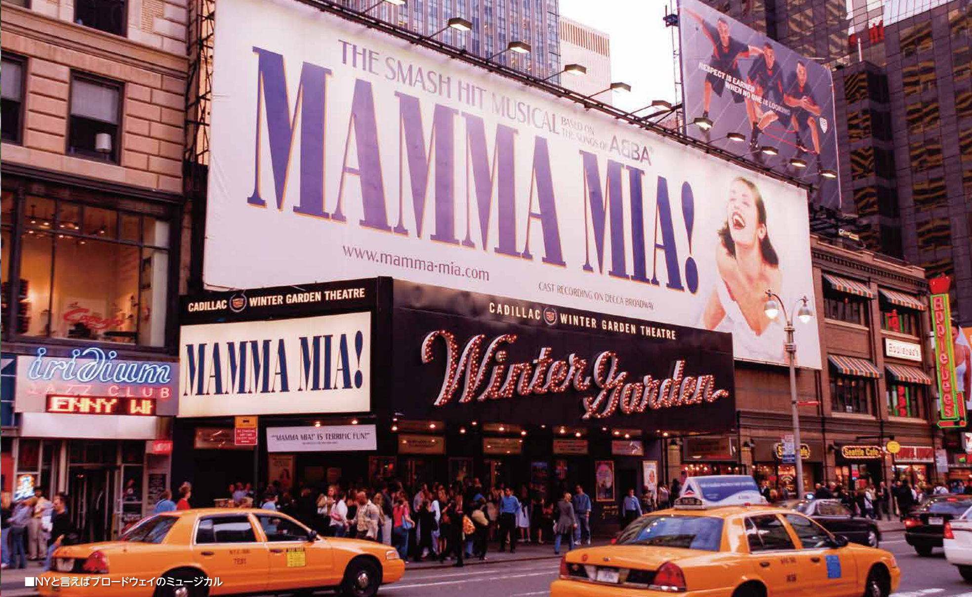
■NYと言えばブロードウェイのミュージカル