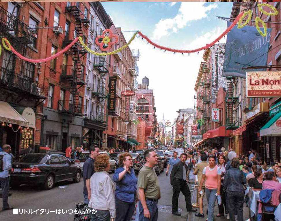
■ リトルイタリーはいつも賑やか