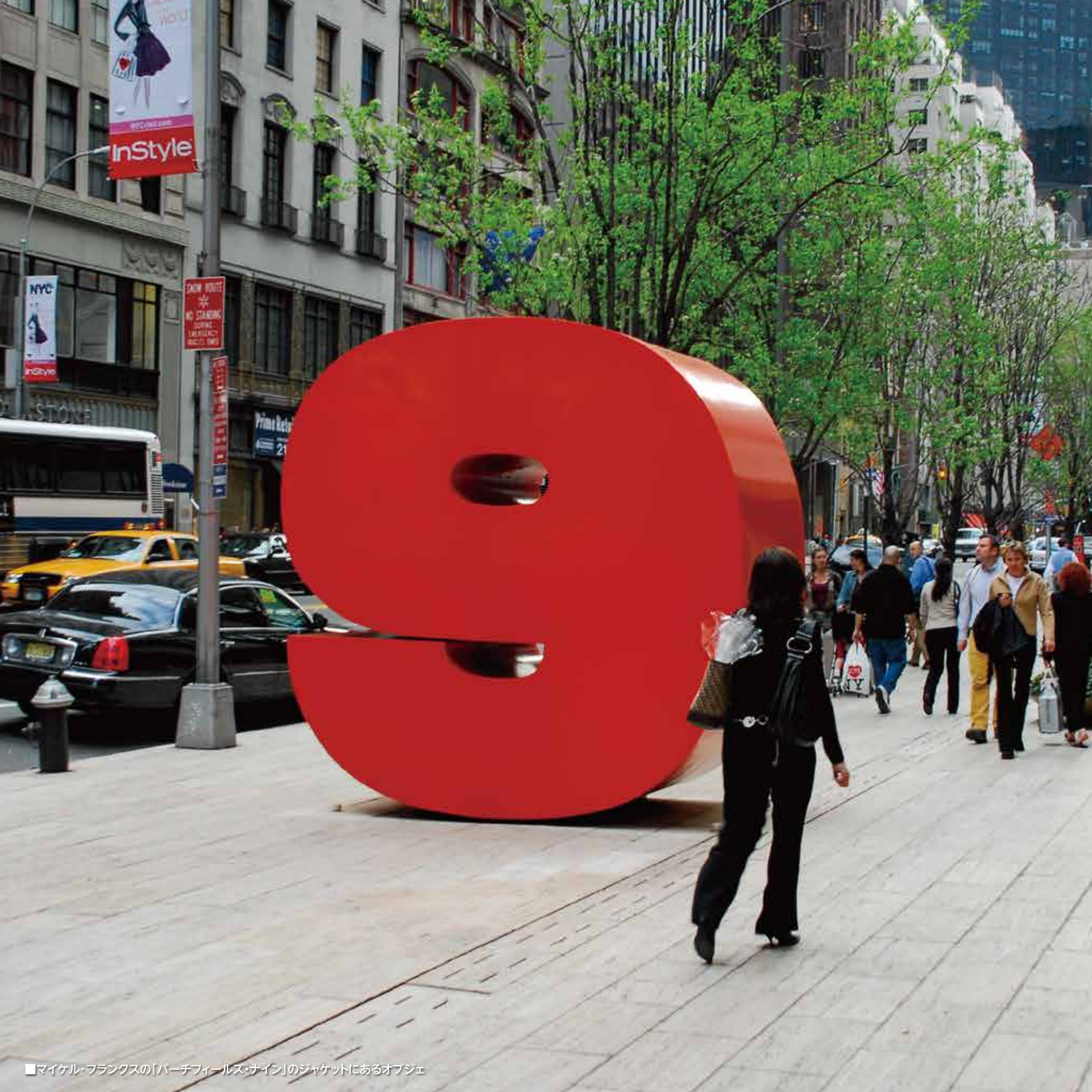
■マイケル・フランクス「パーチフィールズ・サイン」のジャケットにあるオブジェ