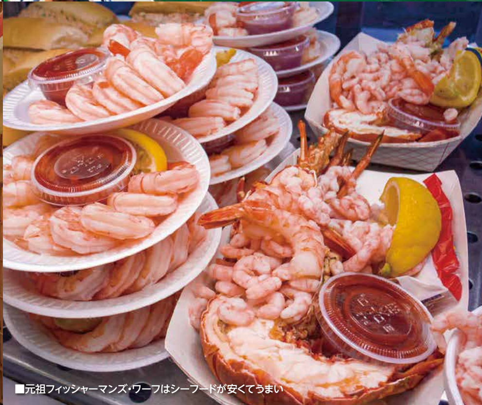
■元祖フィッシャーメンズ・ワーフはシーフードが安くてうまい