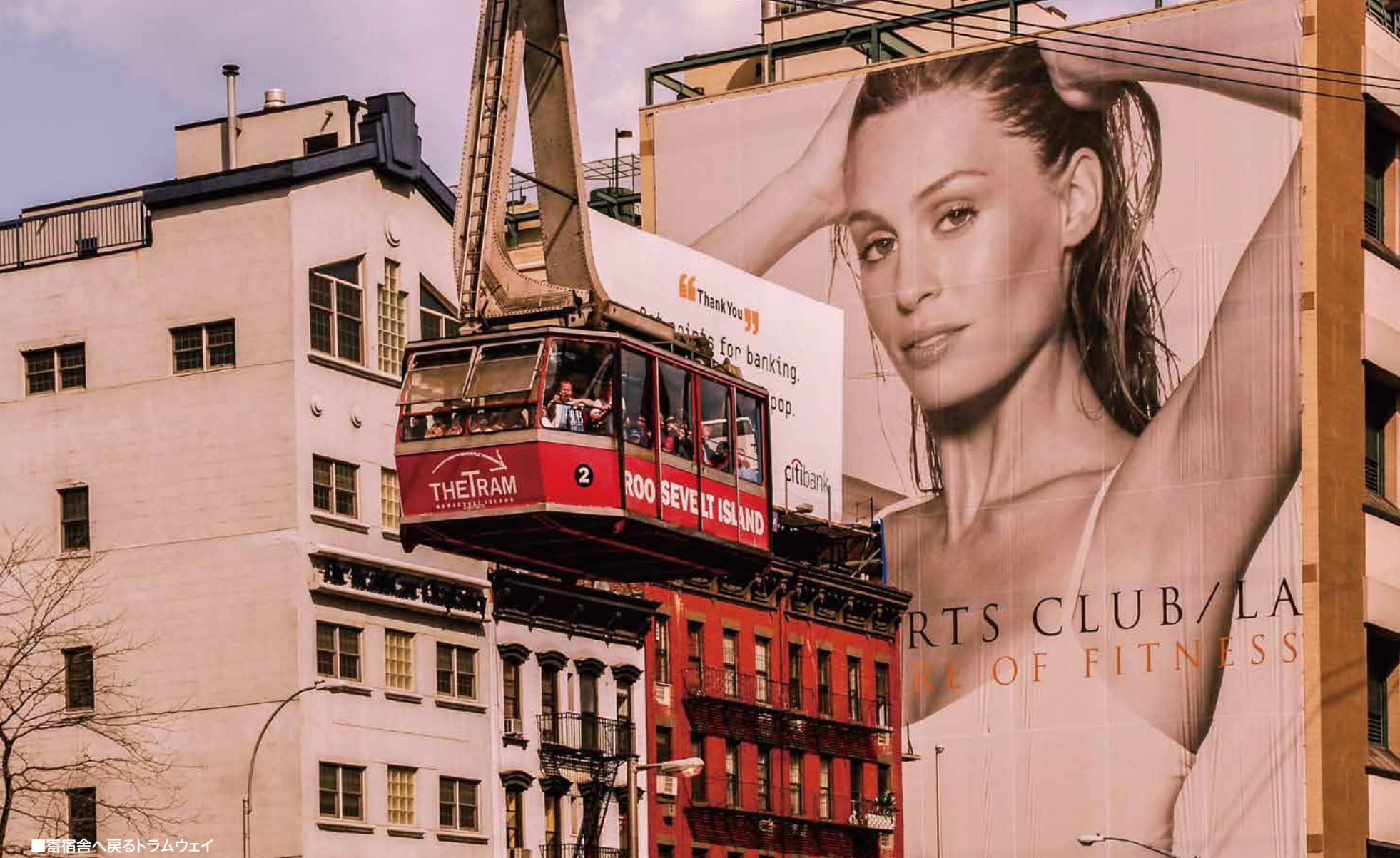
■ 寄宿舍へ戻るトラムウェイ