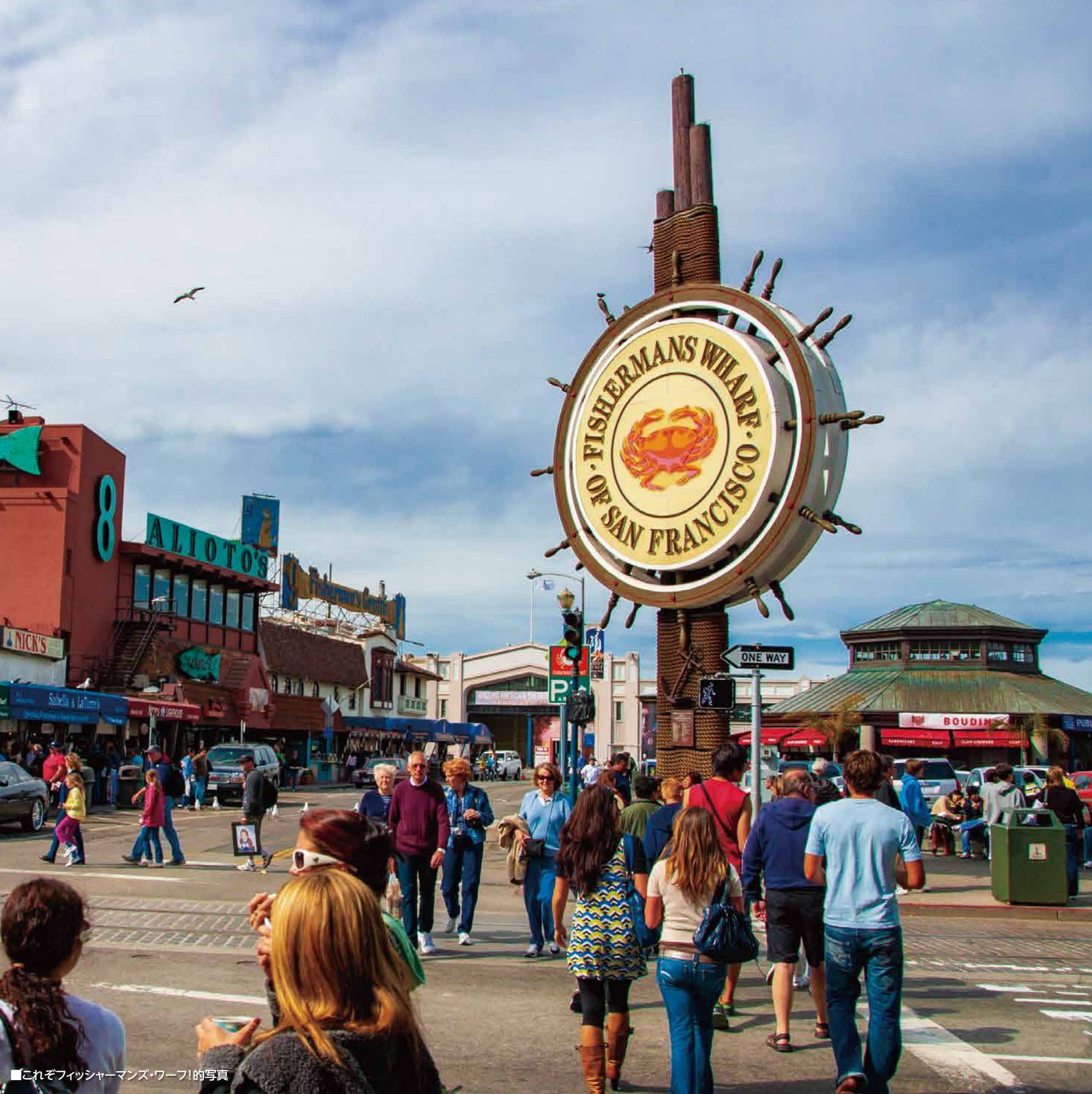
■これぞフィッシャーマンズ・ワーフの写真