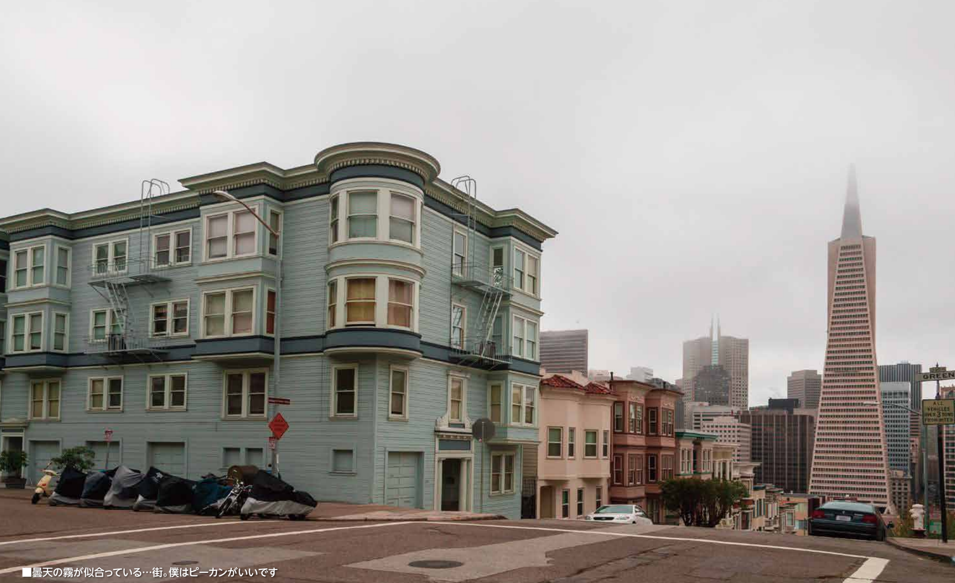
■曇天の霧が似合っている…街。僕はピーカンがいいです