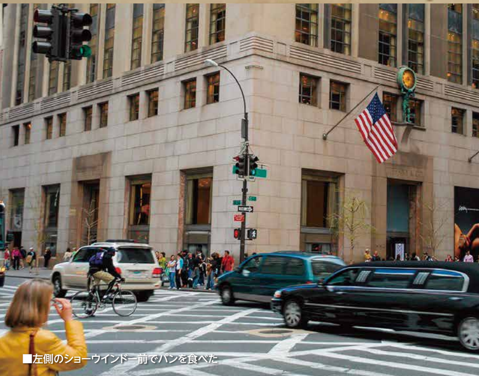
■左側のショーウィンドー前でパンを食べた