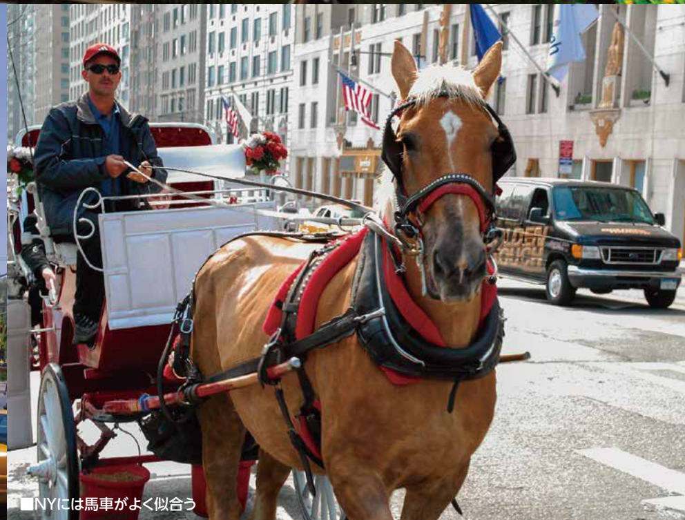
■NYには馬車がよく似合う