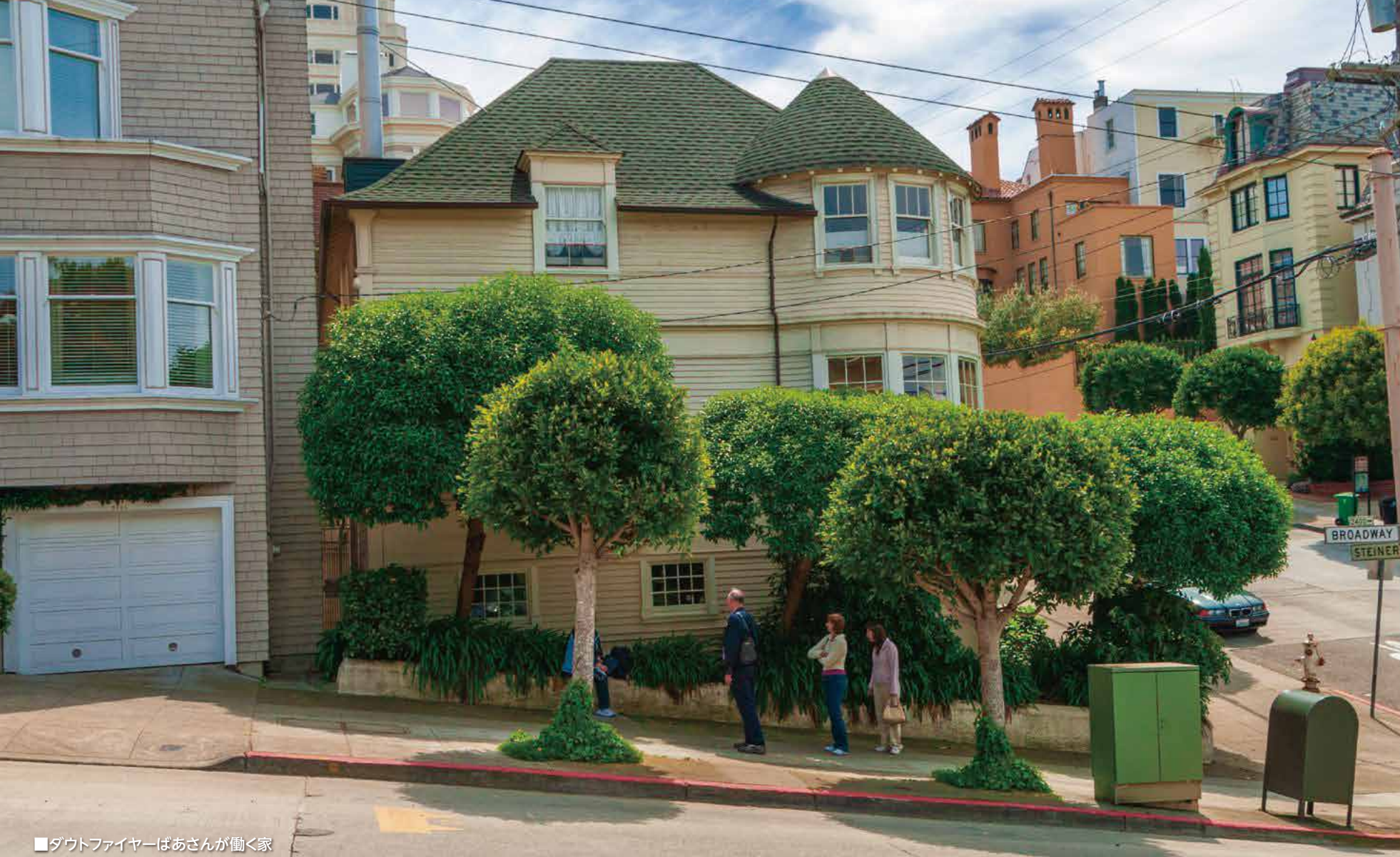
■ダウトファイヤーばあさんが働く家