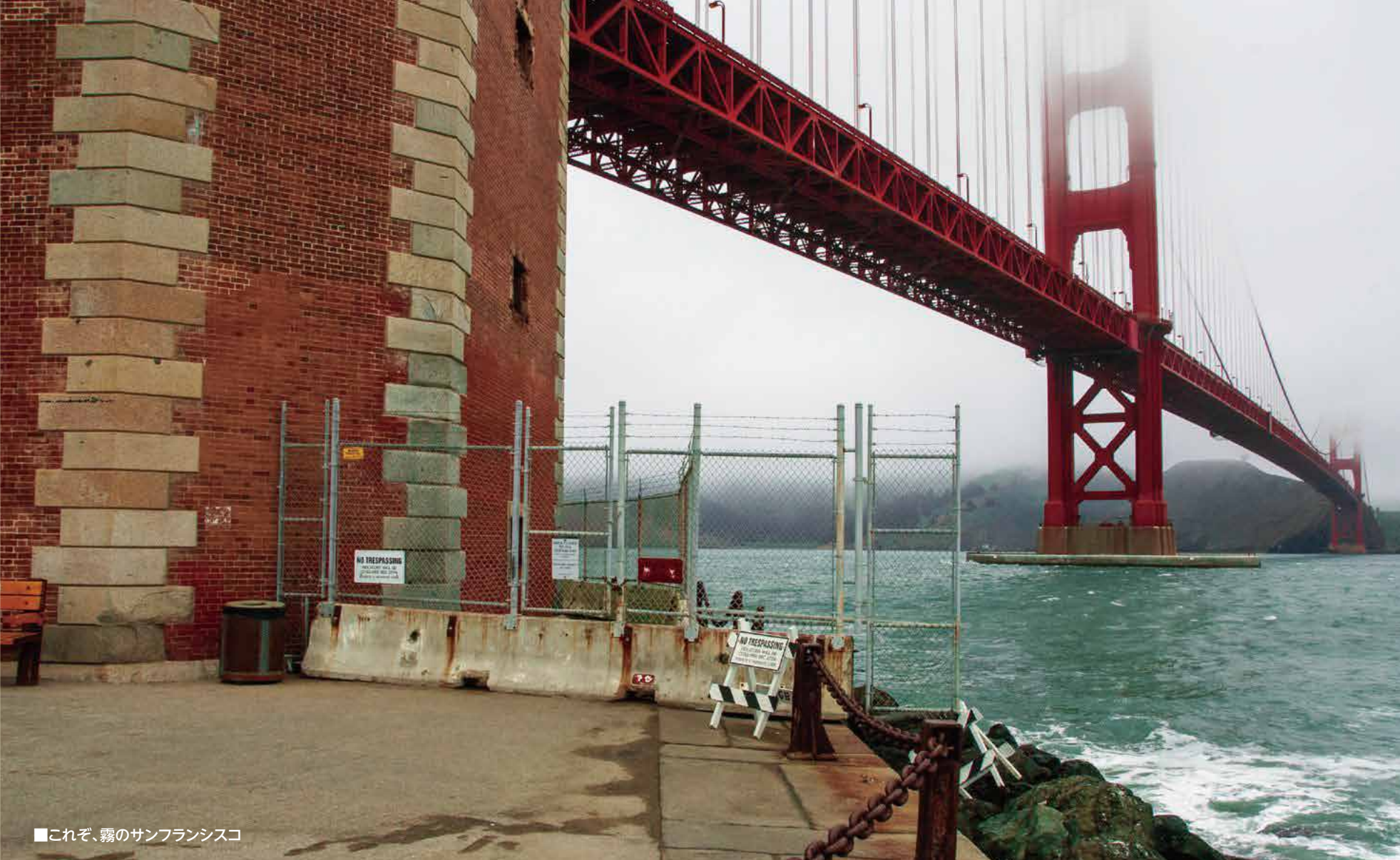
■これぞ、霧のサンフランシスコ