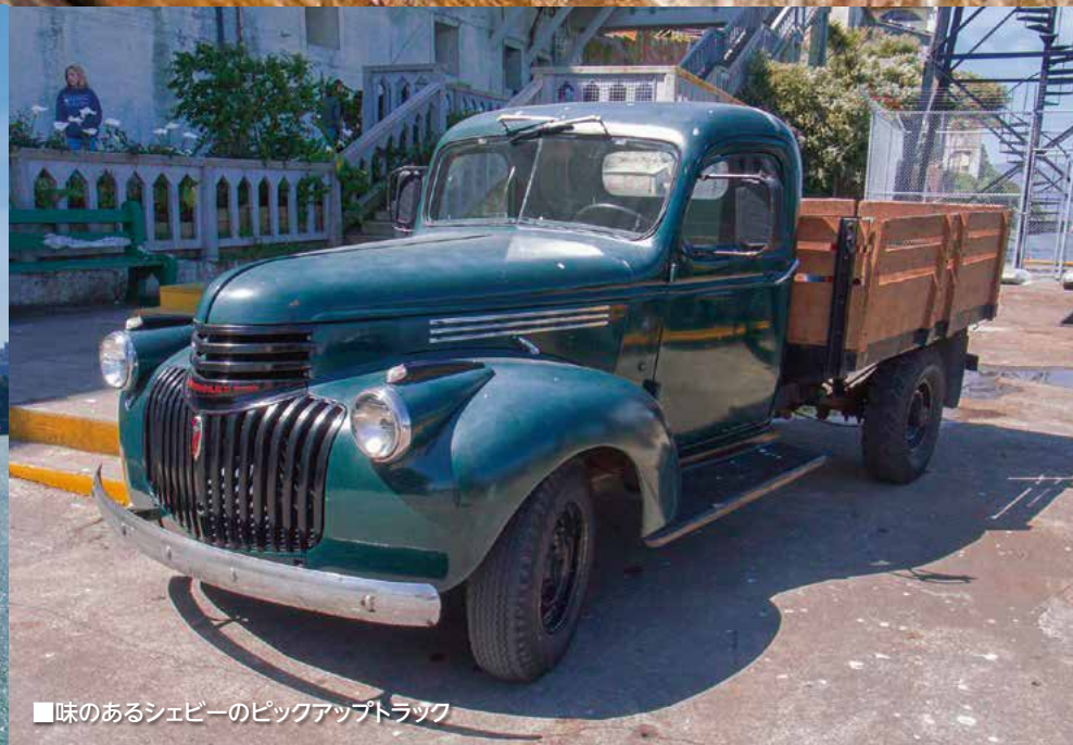
■味のあるシェビーのピックアップトラック