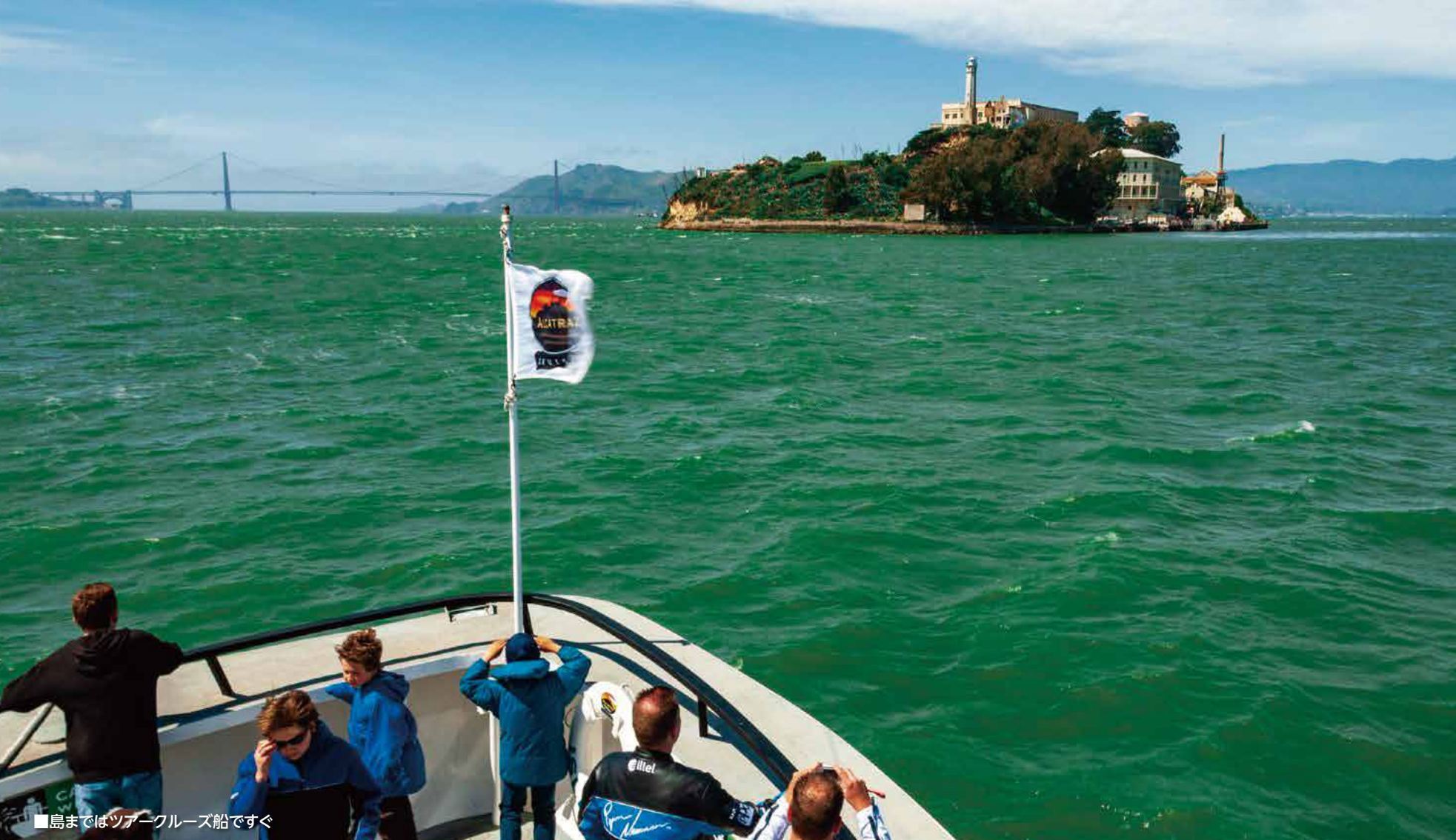
■島まではツアークルーズ船ですぐ