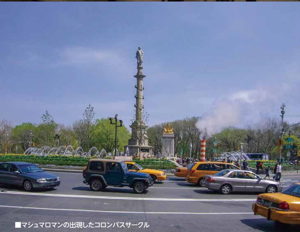
■マシュマロマンの出現したコロムバスサークル