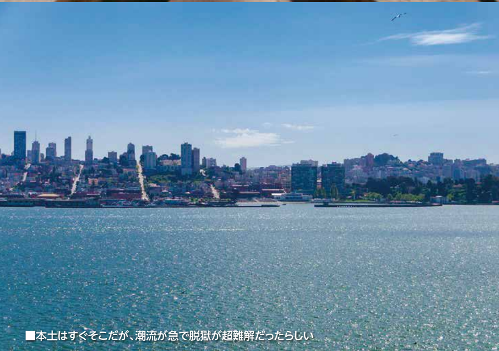
■本土はすぐそこだが、潮流が急で脱獄が超難解だったらしい