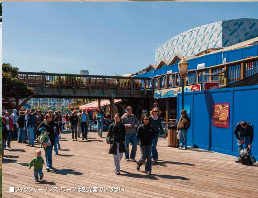
■フィッシャーマンズ・ワーフは観光客でいっぱい