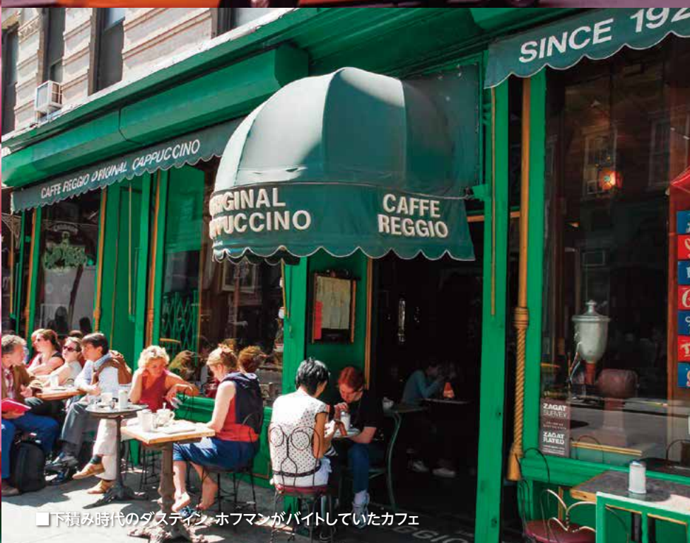
■下積み時代のダスティン・ホフマンがバイトしていたカフェ