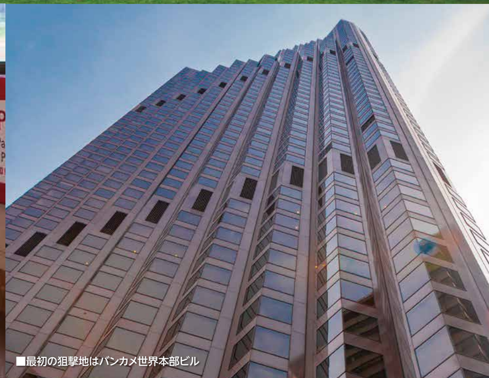
■最初の狙撃地はバンカメ世界本部ビル