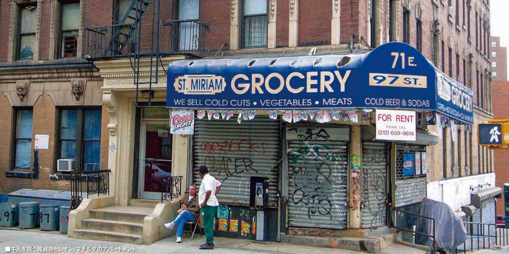
■牛乳を買う雑貨店とレオン/マチルダのアパートメント