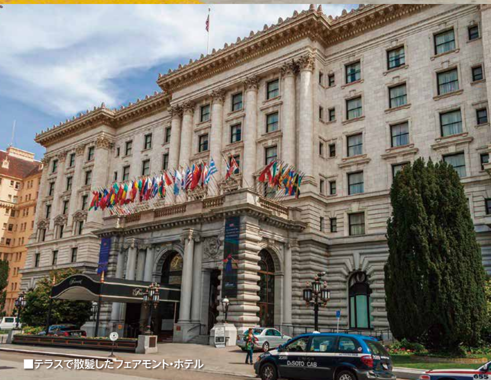
■テラスで散髪したフェアモント・ホテル