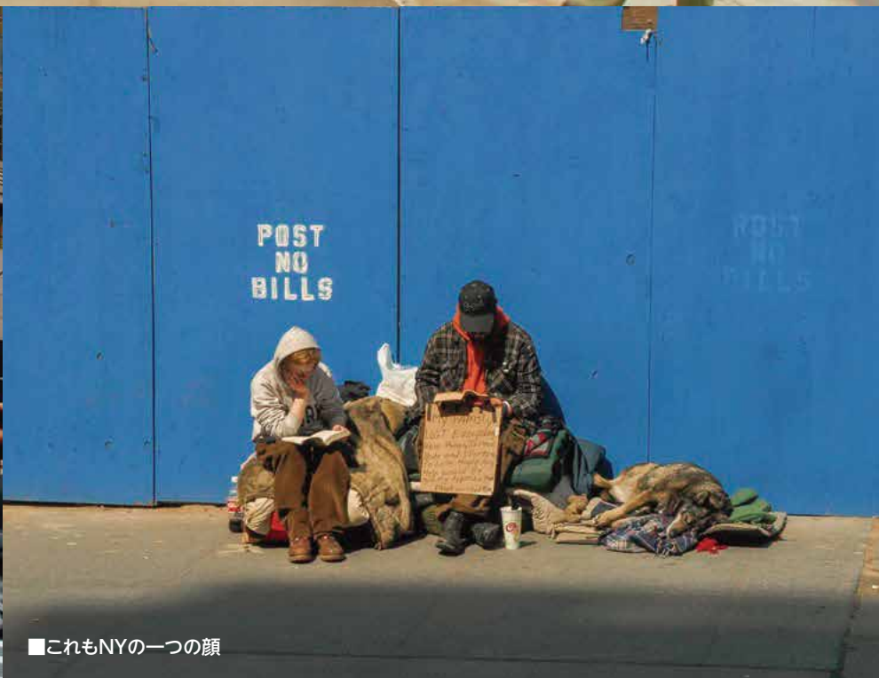
■これもNYの一つの顔