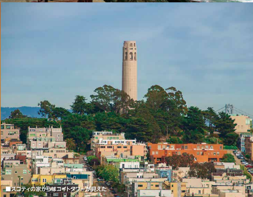
■スコティの家からはコイトタワーが見えた